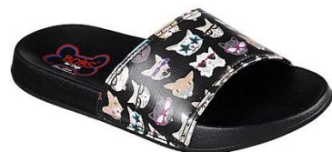
BOBS2 ND PAWTOPIA / ¥3,500-

全BOBS商品のうちいずれかをお買い上げ頂くと、売り上げ金の一部がALMA（アルマ）へ寄付されます。（Dog柄/Cat柄以外の商品も含まれます。）