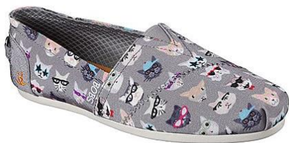
BOBS Plush Kitty Smarts / ¥4,900-